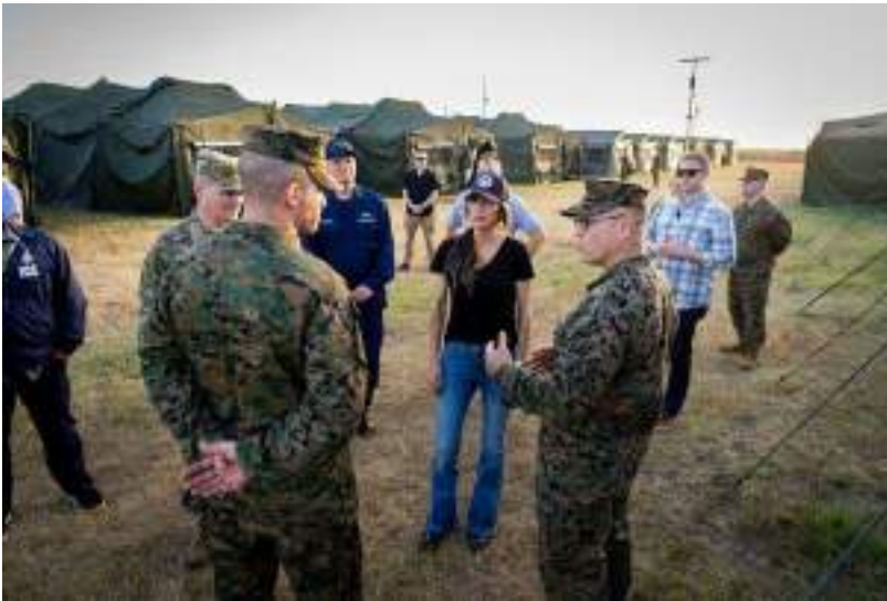
Kristi Noem, the homeland security secretary, was the first cabinet secretary to visit the base at Guantánamo Bay in February.

On Saturday, hours after the delegation issued a statement urging the administration to “immediately cease this misguided mission,” an Air Force C-130 cargo plane from San Antonio brought 12 more migrants to the operation.