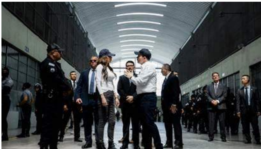
Kristi Noem en el Centro de Confinamiento del Terrorismo (CECOT) este miércoles. Foto: EFE | Vídeo: REUTERS: HTTPS://YOUTU.BE/oW3G3-NN7BK

Un poco después, ya con blazer y sin la gorra de las excursiones, Noem firmó un memorando de cooperación para actualizar oficialmente su alianza en materia de seguridad. Según lo anunciado, el acuerdo asegura el intercambio de información y expedientes de fugitivos para que no se suelten por error criminales salvadoreños en Estados Unidos.