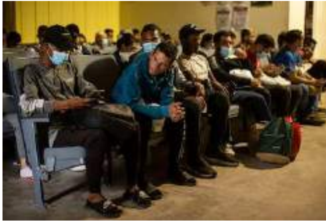
Migrantes beneficiados por el 'parole' esperan su turno para abordar un autobús en Eagle Pass, Texas, en mayo de 2022.

Los 532.000 migrantes que entraron al país con el programa de protección que Trump ha derogado tienen un mes para volver a su país o se enfrentarán "consecuencias adversas"