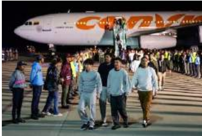
Venezolanos deportados de Estados Unidos descienden de un avión en el aeropuerto internacional Simón Bolívar, este 24 de marzo en Maiquetia, Venezuela.

latinoamericanos, ellos no tienen un consulado o una embajada donde pedir ayuda legal, porque Estados Unidos y Venezuela rompieron relaciones diplomáticas en 2019. Detenerlos y deportarlos sería tan sencillo como pescar en un balde.