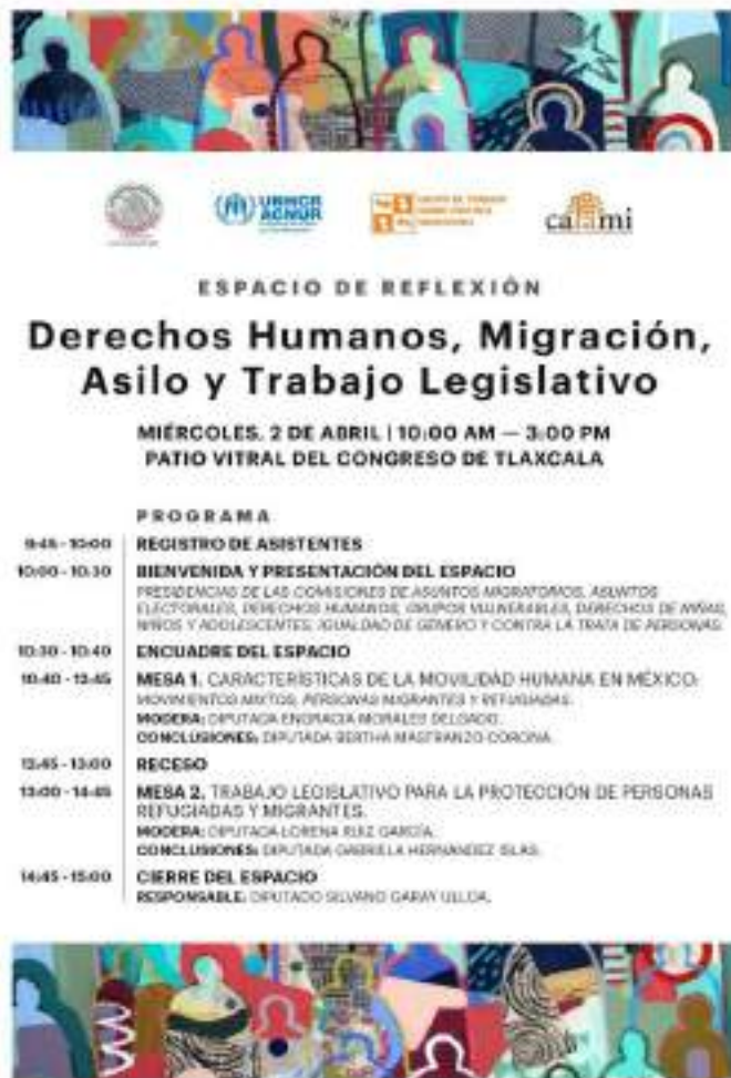
Vea imágenes del evento presencial