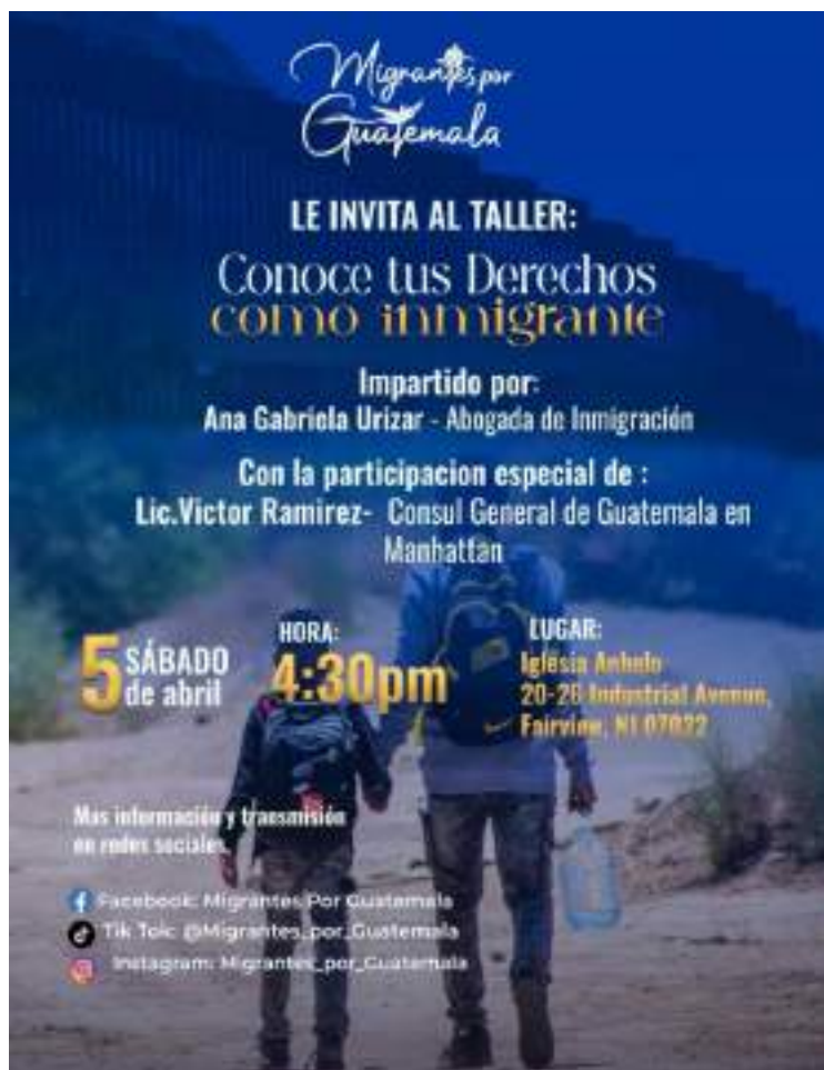
Página de Facebook de la organización