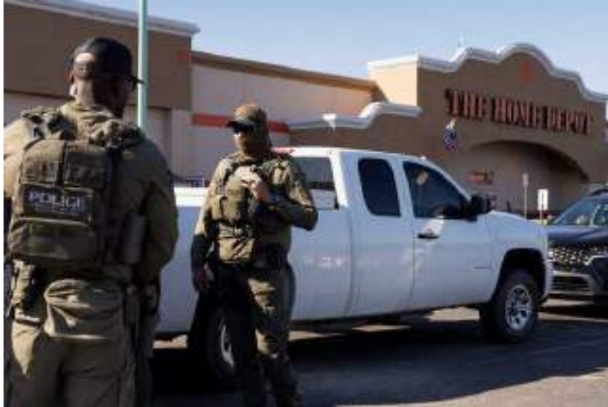
Agentes del Servicio de Inmigración y Control de Aduanas en Tucson, Arizona, este año. El gobierno de Trump dijo que el ICE tenía conocimiento de que Kilmar Armando Abrego Garcia estaba en el país legalmente.

Kilmar Armando Abrego Garcia, quien estaba en Estados Unidos legalmente, está ahora encarcelado en El Salvador. Según el gobierno de Trump, los tribunales federales no tienen jurisdicción para liberarlo.