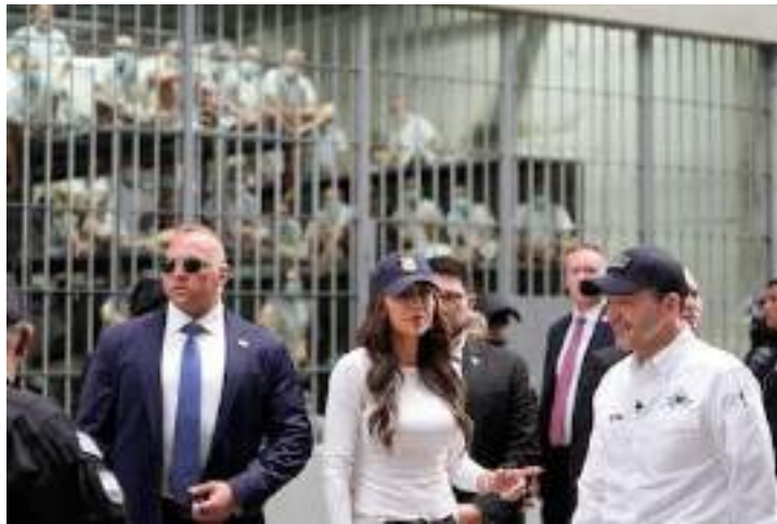
Kristi Noem durante el recorrido en el CECOT.

Un poco más tarde, el secretario de Estado, Marco Rubio, aportó más claridad con un mensaje propio acompañado de tres emoticonos: la bandera de El Salvador, la de Estados Unidos y dos manos estrechadas. El mensaje de Rubio dice: “Hemos enviado a dos peligrosos líderes de la MS-13 [Mara Salvatrucha, la más importante pandilla salvadoreña] y a 21 de sus miembros más buscados de regreso a El Salvador para que comparezcan ante la justicia. Además, como prometió el presidente de Estados Unidos, enviamos a más de 250 extranjeros enemigos del Tren de Aragua, a quienes El Salvador se comprometió a mantener en sus excelentes cárceles a un precio justo [20.000 dólares anuales por preso o seis millones de dólares anuales, según diferentes estimaciones] que también ahorrará dinero a nuestros contribuyentes. El presidente @nayibbukele no solo es el líder de seguridad más fuerte de nuestra región, sino que también es un gran amigo de Estados Unidos . ¡Gracias! ”.