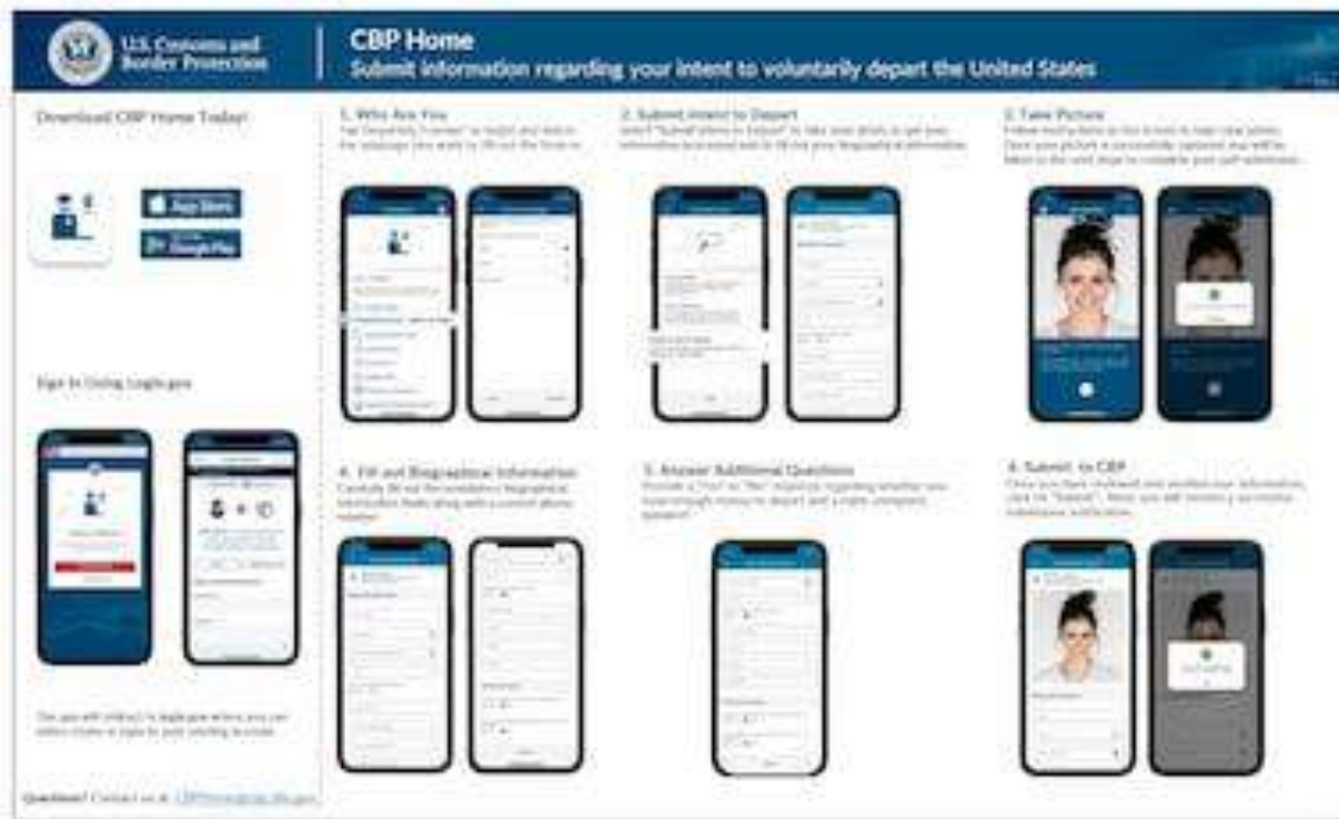
Una infografía compartida por el Gobierno con instrucciones para usar la aplicación CBP Home para autodeportarse.

una fecha para que salgan de manera definitiva del país, a pesar de que muchos en este tiempo han construido una familia, adquirido propiedades o han pagado impuestos.