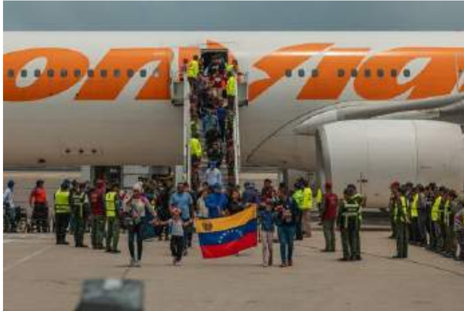
Migrantes venezolanos que fueron enviados a su país desde México, el 20 de marzo.

Los venezolanos con Estatus de Protección Temporal están desafiando los esfuerzos del gobierno de Trump por poner fin al programa para muchos migrantes.