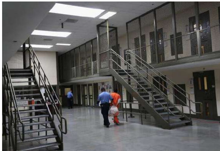
A guard escorted an immigrant detainee at a facility owned and operated by Geo Group in Adelanto, Calif.

Mr. Zoley, whose family moved to the United States from Greece when he was a child, started Geo Group in 1984 as a division of a security guard business. When the prison population exploded in the 1980s, the company expanded into running private prisons. It now has about 100 facilities.