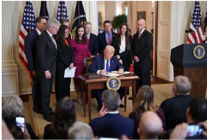
President Trump signed the Laken Riley Act, the first bill of his new administration, in January.

Geo Group said allegations that it had blocked changes to the surveillance program “are part of a politicized effort by open borders groups to interfere with the federal government’s immigration enforcement efforts and to abolish immigration enforcement writ large.”