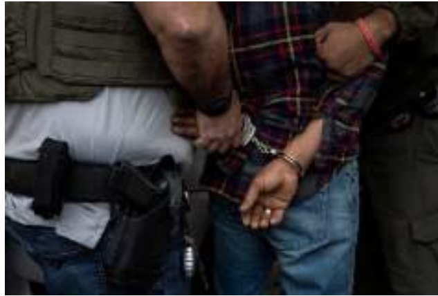
A person from Mexico, handcuffed during an arrest by federal law enforcement agents last month in Georgia.

The tax agency is nearing an agreement to verify whether ICE officials have the right address for people they are trying to deport.