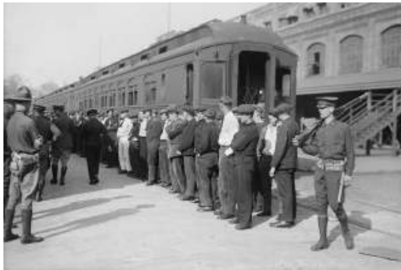
Inmigrantes alemanes preparándose para su deportación en Hoboken, Nueva Jersey, durante la Primera Guerra Mundial en 1918. La Ley de Enemigos Extranjeros se utilizó para repatriar a inmigrantes durante las dos guerras mundiales.

A primera vista, la ley parece requerir no solo que exista una invasión o incursión, sino un vínculo con las acciones de un gobierno extranjero.