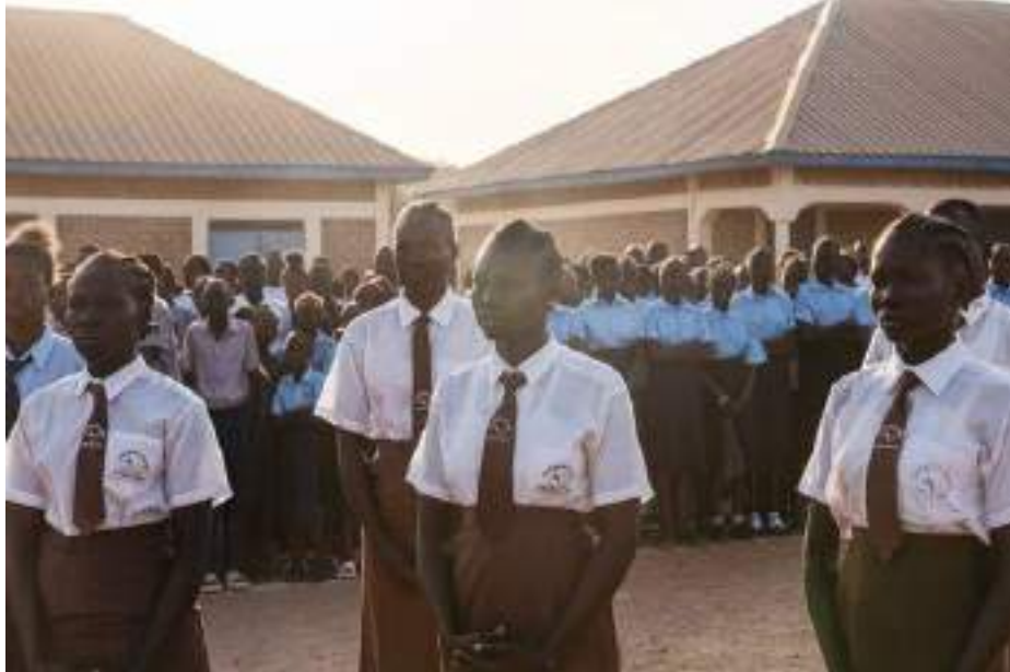
Cornerstones Vision Academy has 2,200 students.