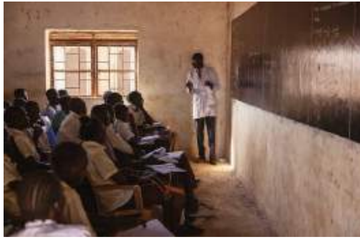
Class in session at Cornerstones Vision Academy in Aweil, South Sudan.

Many schools around the country stopped functioning during the civil war. Public school teachers haven't been paid their salaries for the last year, so they aren't inclined to teach. Twice as many "schools" operate outside under trees as in permanent buildings. More than 70 percent of South Sudanese children do not attend school.