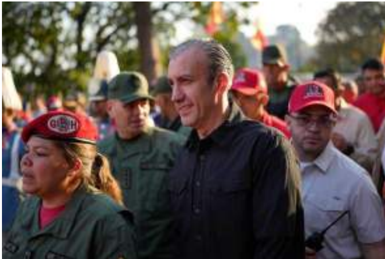
Tareck El Aissami fue nombrado vicepresidente por Maduro en 2017, tras haber sido gobernador del estado venezolano de Aragua. El Aissami está siendo procesado por el gobierno de Maduro.

El sábado, mientras aviones trasladaban migrantes venezolanos a El Salvador, el juez James E. Boasberg, presidente del Tribunal Federal del Distrito de Columbia, prohibió temporalmente al gobierno la expulsión sumaria de personas en virtud de la Ley de Enemigos Extranjeros.