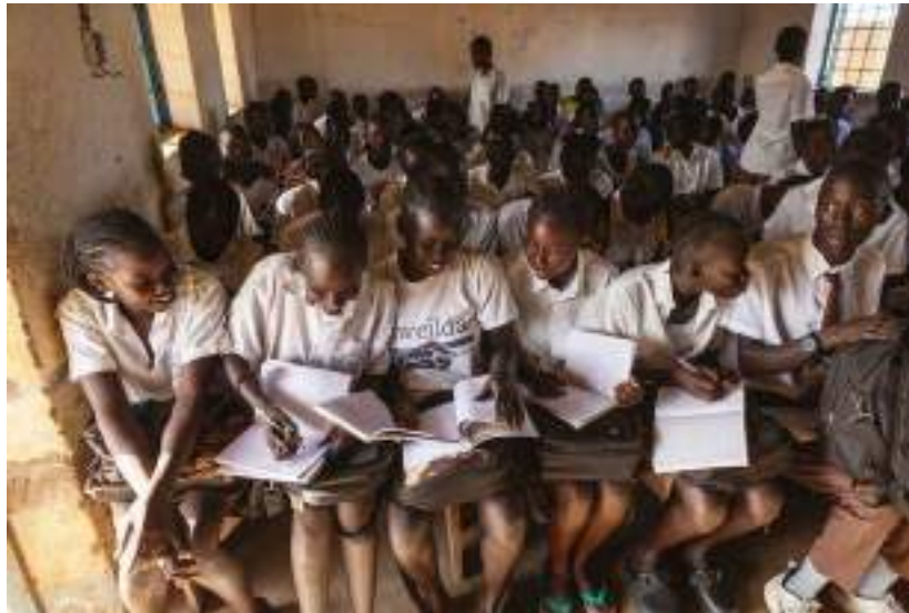
Some classes at Cornerstone have more than 100 students.

“Nothing can stop me from going to university,” she told me, but when I asked she acknowledged that she had no idea how she could raise the $5,000 a year this would cost.