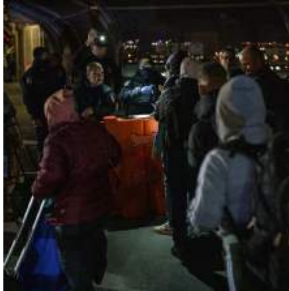
Migrantes llegando a Ciudad Juárez, México, para sus citas con el Servicio de Aduanas y Protección Fronteriza de Estados Unidos en diciembre.

Casi 350.000 personas podrían ser deportadas en breve después de que el gobierno de Trump pusiera fin al Estatus de Protección Temporal, conocido como TPS.