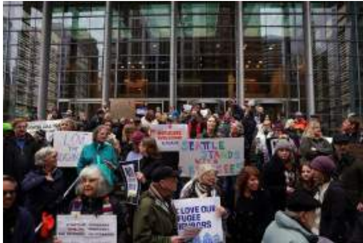
Supporters of a lawsuit challenging an executive order aimed at refugees gathered outside the federal courthouse in Seattle last month.

A court order requires thousands of refugees to be admitted to the United States. But funding for organizations that assist them after arrival remains uncertain.