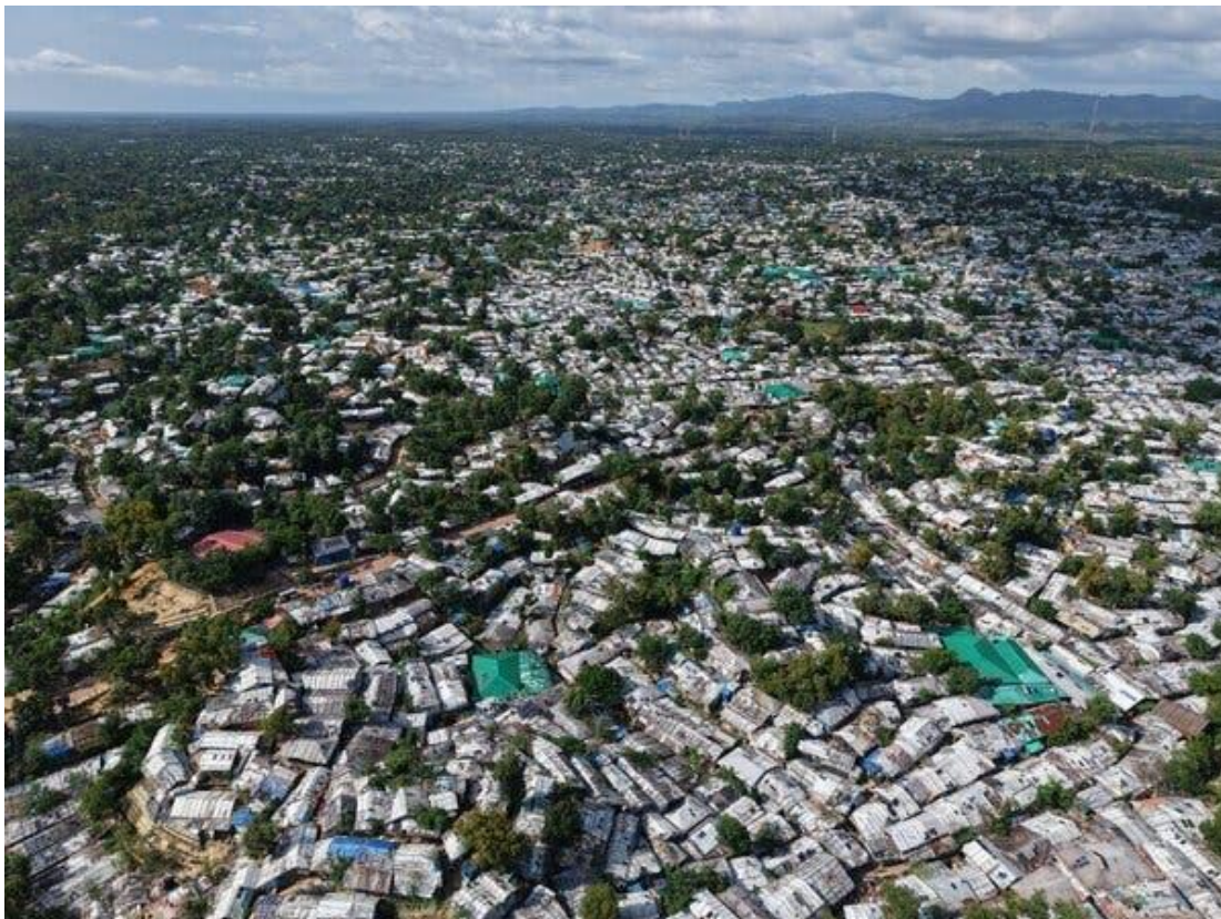
The Rohingya refugee camps in Bangladesh, last month. It is the largest refugee settlement in the world.

Many from the camps said they appreciated that meeting. But grievances about not being present in New York remain, which Bangladesh acknowledges. “It would have been wonderful if they could come,” Mr. Rahman said.