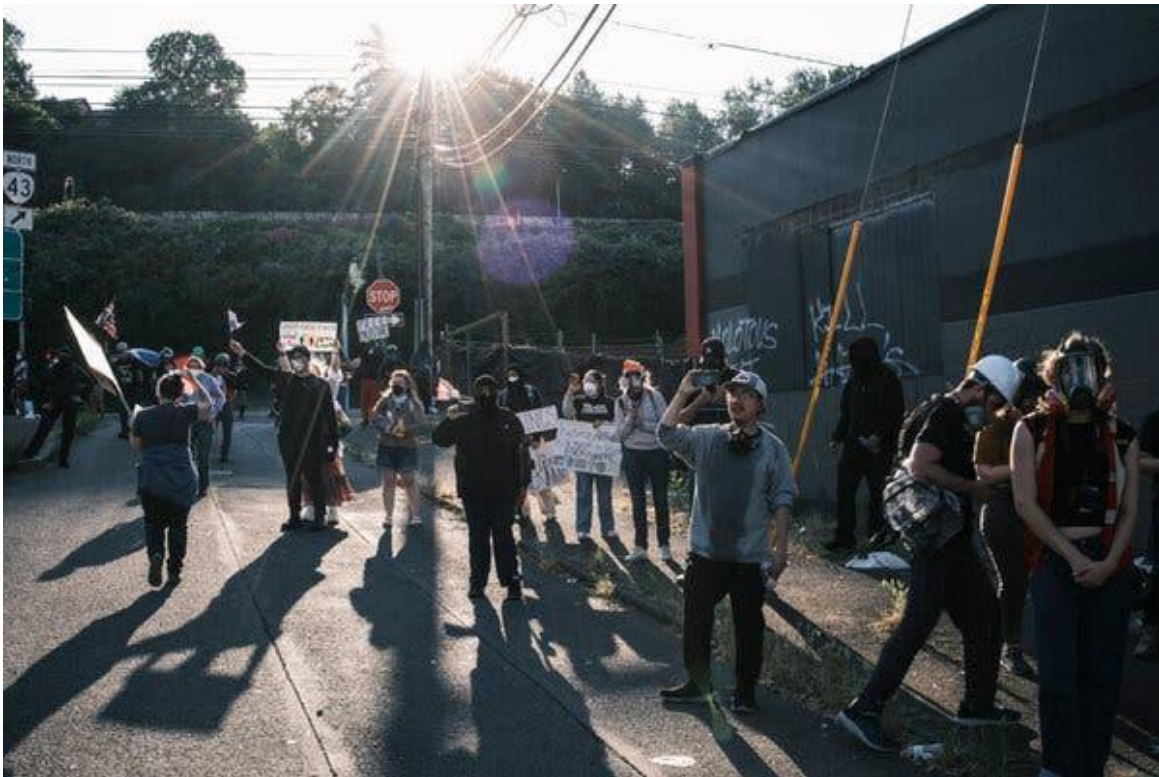
Protesters gathered outside an apparent ICE detention center in Portland in June. Portland is one of the Democratic cities that has been in the president's sights.

The president characterized Immigration and Customs Enforcement facilities as being under siege from domestic terrorists.