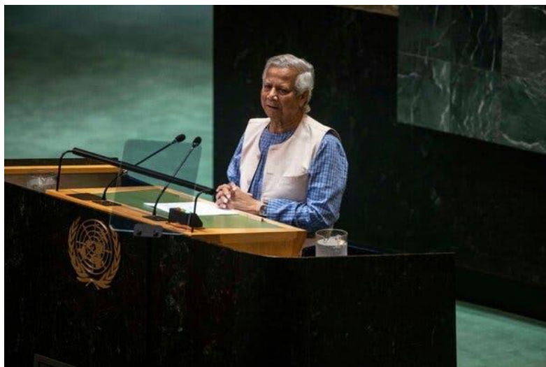
Muhammad Yunus, the interim leader of Bangladesh, at the United Nations last year.

The gathering was arranged at the urging of Muhammad Yunus, the interim leader of Bangladesh and a Nobel laureate, who has pleaded with the world to refocus on the Rohingya’s plight since he came to power in 2024. But the refugees’ hope of returning home has seemed ever more unlikely as a civil war in Myanmar continues to rage.