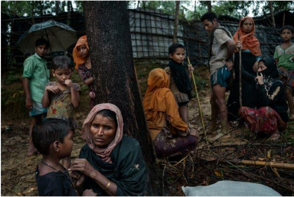
Rohingya refugees at a camp near Amtoli, Bangladesh, in 2017.

World leaders will discuss how to assist the Rohingya in the world's largest refugee settlement. But no one living there is attending the conference at the United Nations.