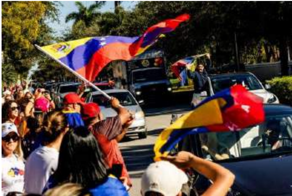
Venezuelans and Venezuelan Americans celebrating in Doral, Fla. on Saturday.

For many, the removal of the Venezuelan leader Nicolás Maduro has not eased uncertainty about their immigration status in the United States.