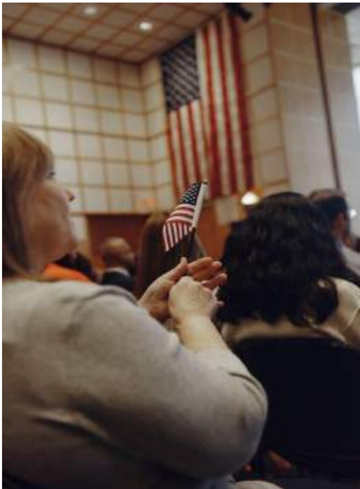
Una ceremonia de naturalización en Boston en agosto. El gobierno de Trump ha estado cerrando lagunas legales en el sistema de migración y poniendo trabas a las personas que desean entrar y permanecer en el país.

Un funcionario de los Servicios de Ciudadanía e Inmigración de Estados Unidos dijo que daría prioridad a “quienes hayan obtenido ilegalmente la ciudadanía estadounidense”.