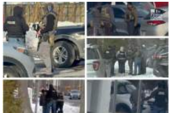
Al menos 4 personas fueron arrestadas el martes 16 de diciembre en operativos realizados por agentes migratorios en inmediaciones de Hampton Bays y Riverhead.

Según testigos entrevistados por Tu Prensa Local en el lugar de los acontecimientos, los agentes llegaron a las 7:20 de la mañana y se ubicaron justo en el parqueadero en frente de Melrose Deli, entablaron una breve comunicación con una persona sin hogar que se encontraba allí y dijeron que buscaban a un individuo en específico. Los oficiales intentaron abrir la puerta del deli, pero el dueño del establecimiento decidió cerrarla como medida de precaución y los agentes se marcharon. [...]”. Leer nota completa