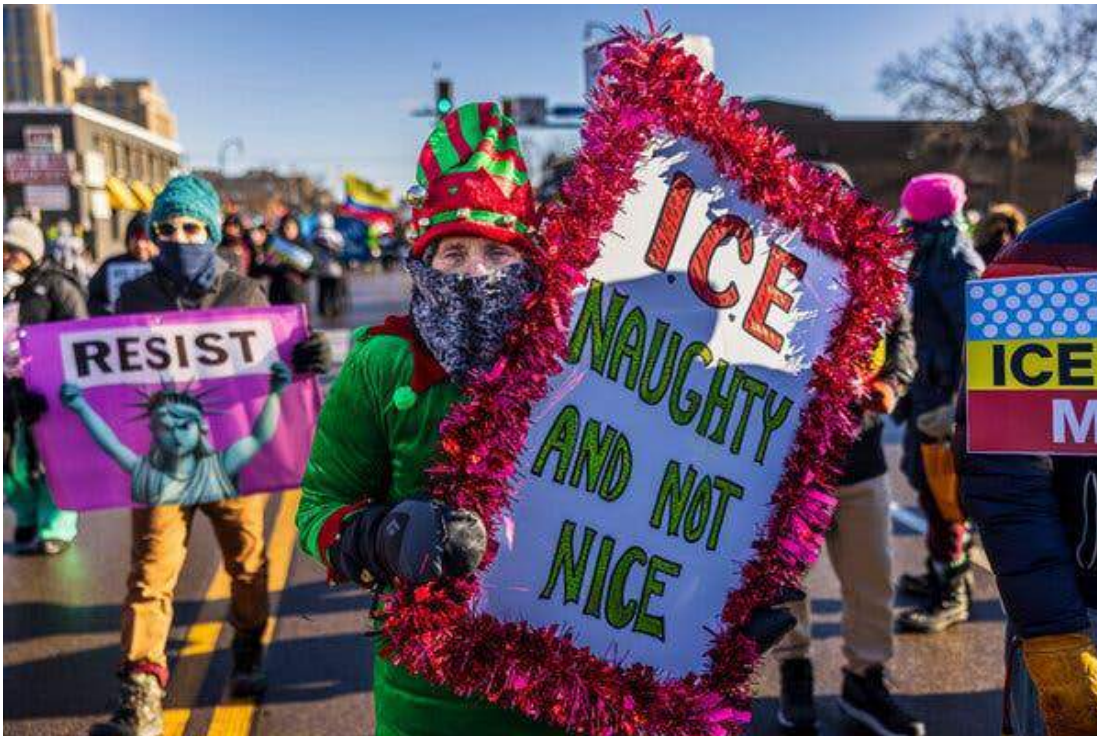
A protest against President Trump's immigration crackdown in Minneapolis on Dec. 20. Agents detained more than 600 people in Minnesota last month.

Everpeak Hospitality , which operates the Lakeville Hampton Inn, wrote in an emailed statement that it was in touch with the affected guests to ensure they are accommodated.