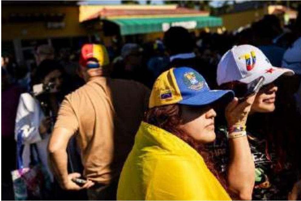
Venezuelans and Venezuelan Americans listen to President Trump's address about the capture of Nicolas Maduro in Doral, Fla., on Saturday.