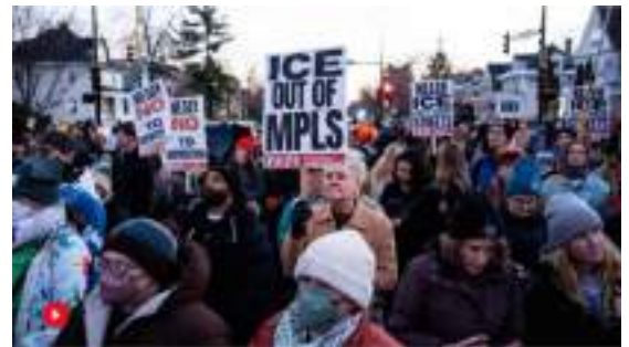
Crowds gathered in Minneapolis on Wednesday as they protested and held a vigil for a woman killed during the Trump administration's latest immigration crackdown.

Videos taken by bystanders with different vantage points and posted to social media show an officer approaching an SUV stopped across the middle of the road, demanding the driver open the door and grabbing the handle. The Honda Pilot begins to pull forward and a different ICE officer standing in front of the vehicle pulls his weapon and immediately fires at least two shots into the vehicle at close range, jumping back as the vehicle moves toward him.[...]” Leer nota completa