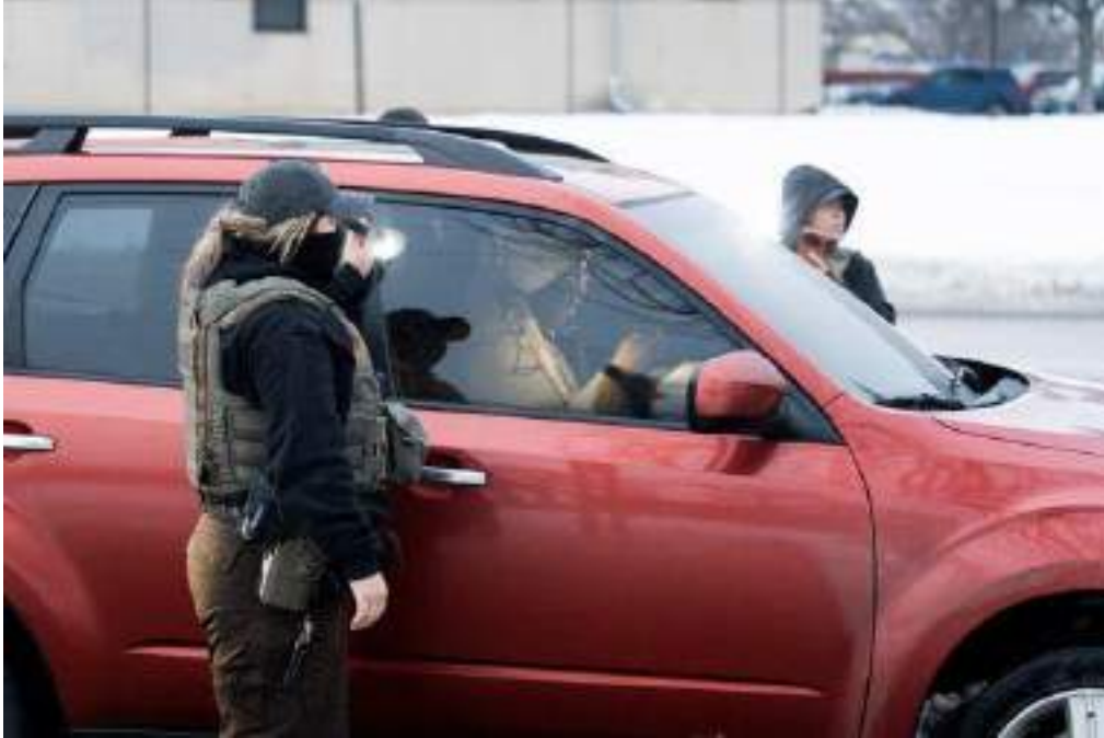
Federal law enforcement agents making a traffic stop in Minneapolis on Monday. No one was detained.

U.S. Immigration and Customs Enforcement officials said the effort was its “largest operation to date.”