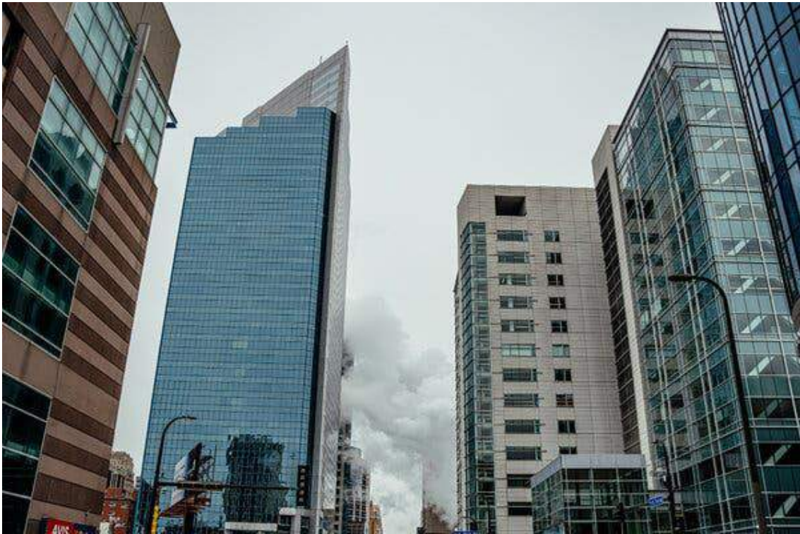
Scores of Immigration and Customs Enforcement agents have been deployed in Minneapolis in recent weeks.

As the U.S. ramps up deportation efforts in Minnesota, the Department of Homeland Security claimed on social media that a Hampton Inn had canceled agents' bookings.