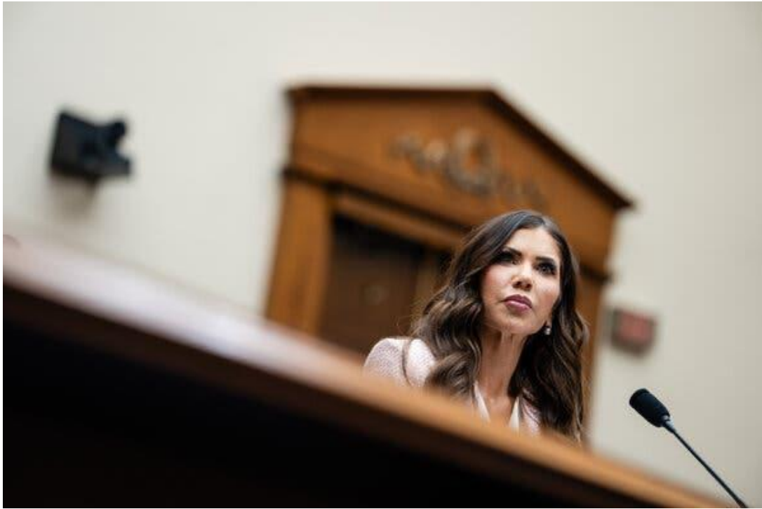
Kristi Noem, exsecretaria de Seguridad Nacional, testificaba ante legisladores esta semana en el Capitolio.

El presidente dijo que sustituiría a la secretaria de Seguridad Nacional por el senador Markwayne Mullin