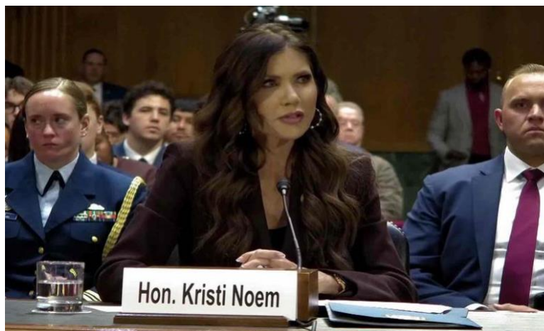
During a Senate Judiciary Committee hearing, lawmakers from both parties questioned Kristi Noem about an ad campaign that featured her, for which the government paid $220 million. President Trump fired Ms. Noem on Thursday.

( https://www.nytimes.com/es/2026/03/05/espanol/estados-unidos/trump-kristi-noem.html?rsrc=flt&smid=url-share )