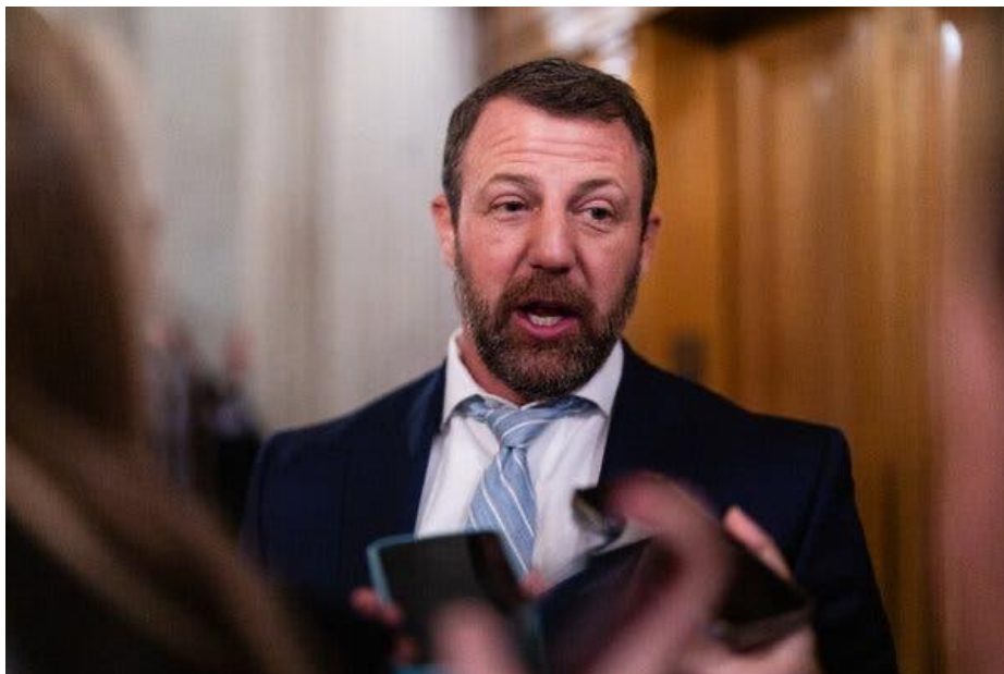
El senador Markwayne Mullin, republicano por Oklahoma, es la elección de Trump para sustituir a Noem.

El miércoles, la empresa publicó en las redes sociales que tenía un subcontrato con una firma que tenía un contrato con el departamento, y que era una entidad distinta la que tenía el contrato mayor.