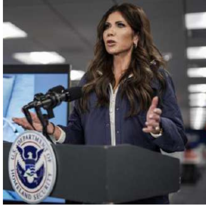
Kristi Noem