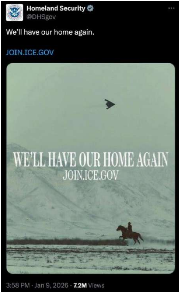
A social media post from the Department of Homeland Security uses the phrase “We’ll Have Our Home Again,” which is also the title of a song written by white nationalists and embraced by groups like the Proud Boys.

Less than 40 minutes after the interview on Thursday, the Instagram post — including audio from the song — disappeared from social media . Posts on X and Facebook, which did not include an audio component, are still visible.