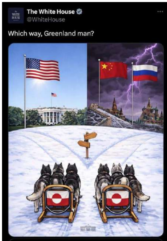
An official White House social post asks, “Which way, Greenland Man?” The question is an echo of the book — “Which Way Western Man?” — that is a foundational text of white supremacists.

As President Trump escalated his campaign to seize control of Greenland this month, the White House’s X account posted an image of a crossroads, with a sun-drenched White House on the left and Russia and China to the right. The caption read, “Which way, Greenland man?” Last year, an ICE recruitment post on Homeland Security’s X account asked, “Which way, American man?”