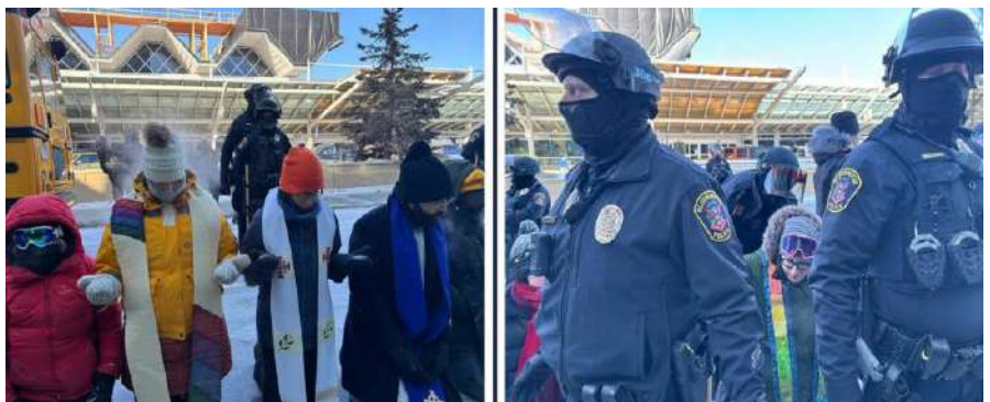
Escenas fuera del Aeropuerto Internacional de Mineápolis-Saint Paul, donde 100 clérigos participaron en un acto de desobediencia civil para protestar contra el ICE el 23 de enero de 2026.