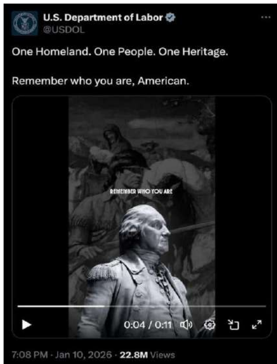
A Department of Labor’s social post uses a phrase, “One Homeland. One People. One Heritage,” which experts on extremism say echoes a Nazi slogan, “One People, One Country, One Leader.”