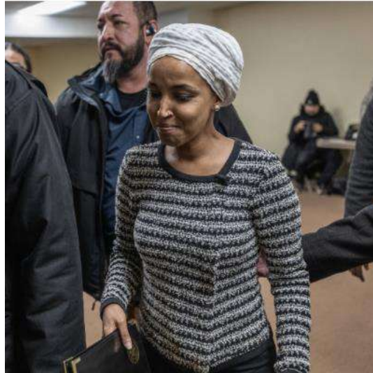
Representative Ilhan Omar leaving a town hall yesterday.