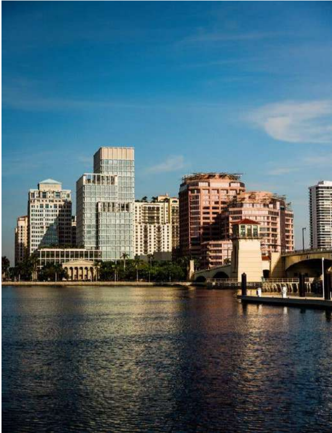
Population growth in Florida slowed markedly last year, according to new census estimates.

New census estimates show the effects of falling birthrates and President Trump's anti-immigration policies. As his term continues, immigration is expected to drop even further.