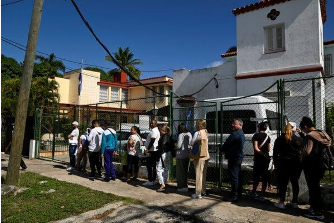
Cubanos haciendo cola ante la embajada de Nicaragua en La Habana el lunes, después de que Nicaragua pusiera fin a la entrada sin visado para los ciudadanos cubanos.

El gobierno de Trump ha criticado a la gestión nicaragüense por servir de vía de migración ilegal hacia el norte.