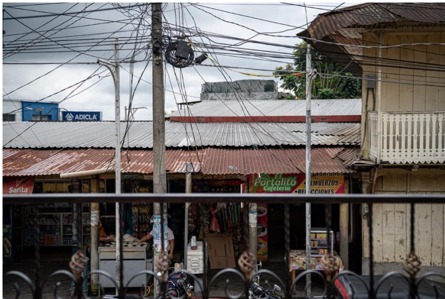
Ventas de comida, techos de lámina y cables sobre una de las calles del centro de Santo Tomás La Unión.

Aquí la población cultiva café o trabaja en albañilería. Otros abren talleres o tiendas; «cada quien tiene su changarrito», añade Isaías. Consideró comprar un mototaxi para emprender, pero la inversión ronda los Q50 mil, suma que no posee.