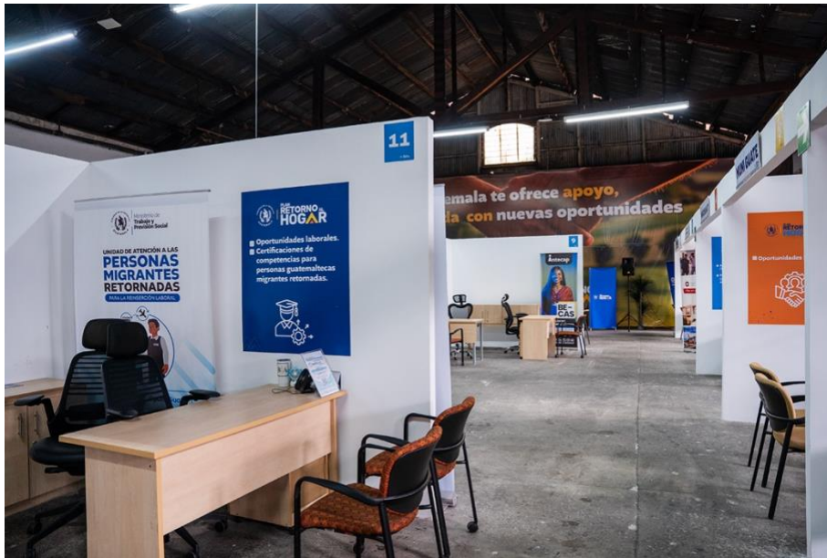
Un día normal en el Centro de Atención a Retornados, cuando no arriban vuelos en Guatemala.