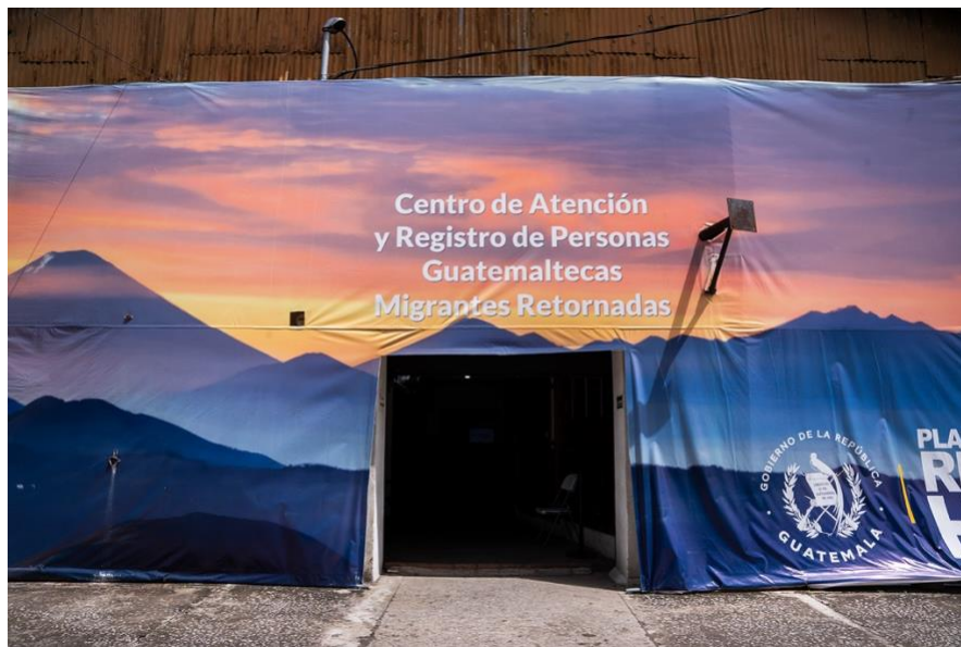
Una enorme manta vinílica con los volcanes de Guatemala da la bienvenida al Centro de Atención a Retornados, sede del programa "Plan Retorno al Hogar", en la capital.

En el norte el dinero no crece en los árboles; es un sacrificio. Implica jornadas desde la madrugada hasta la noche, a veces con una sola comida al día. «Uno busca cómo sobrevivir», afirma para desmentir el concepto del sueño americano. «Allá no hay descanso. No es fácil», sentencia.