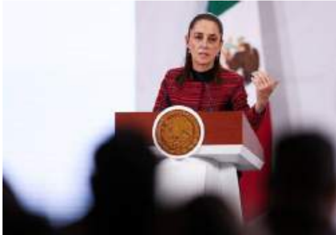
President Claudia Sheinbaum of Mexico at a news conference on Monday.

Claudia Sheinbaum, president of Mexico, said her country would take legal steps to demand better conditions at immigration detention facilities, where she said 14 Mexican citizens had died since President Trump took office.