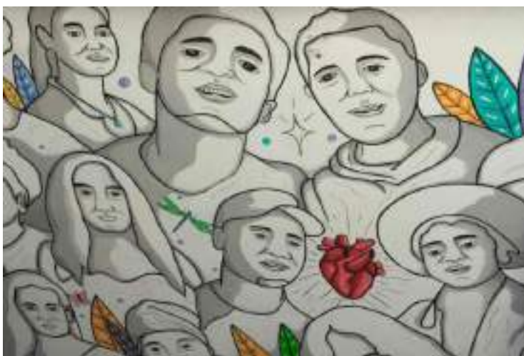
“El mural pintado en una de las paredes de casa frida muestra a un grupo diverso de personas desplazadas que han pasado por el refugio” mural: Personas desplazadas.

La Agencia de la ONU para los Refugiados (ACNUR) ha señalado que la principal causa del desplazamiento es la violencia generada por el crimen organizado, seguida de fenómenos naturales. Datos de la Comisión Mexicana de Defensa y Promoción de los Derechos Humanos indican que, en 2024, al menos 28 mil personas se desplazaron de sus hogares debido a las estructuras criminales.[...]” Leer artículo completo