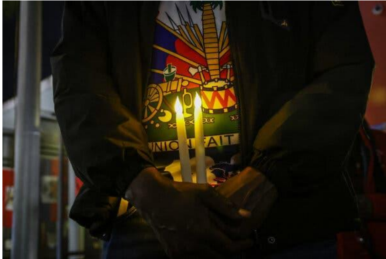
A candlelight vigil in Miami in February for Haitians living under Temporary Protected Status, which the Trump administration is trying to end.

The case deals with Temporary Protected Status for hundreds of thousands of Haitians and Syrians but could have implications for more than a million from troubled nations.