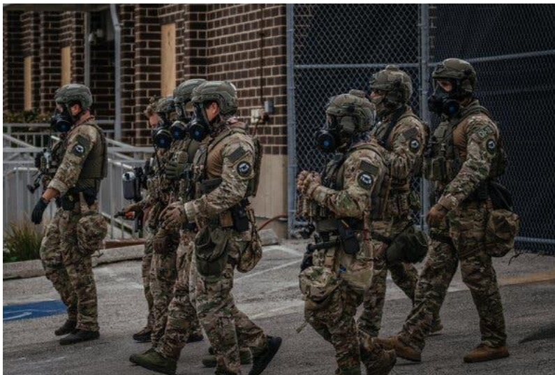
Federal agents outside a U.S. Immigration and Customs Enforcement facility in Chicago last year.

The measure will allow the G.O.P. to begin working on a filibuster-proof bill to fund ICE and C.B.P., part of their plan to reopen the long-shuttered Department of Homeland Security.