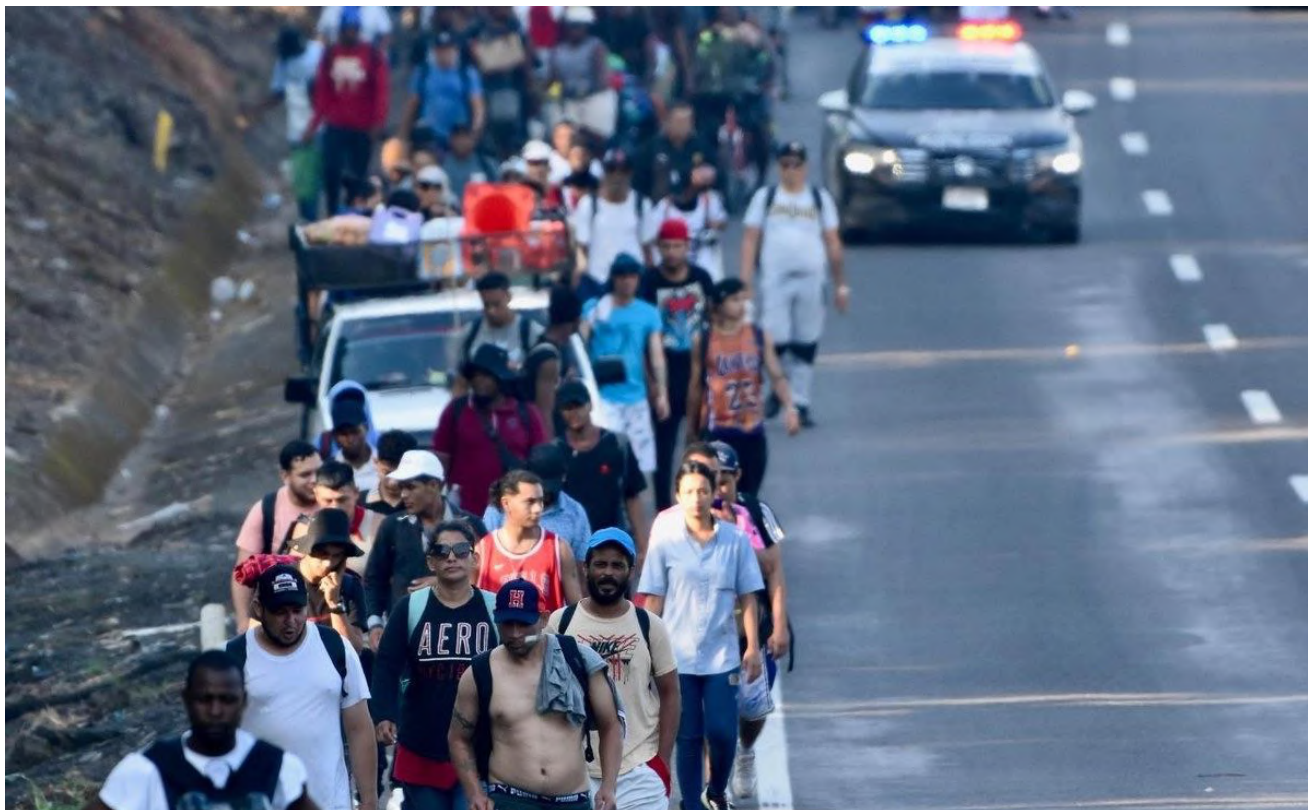
Durante su paso por los municipios de Huehuetán, Huixtla y Escuintla, donde han hecho escala, han recibido ayuda humanitaria de las instituciones de Salud y Protección Civil, principalmente.

Según organizaciones de la sociedad civil, en la frontera con Guatemala hay entre 60 mil y 75 mil migrantes varados, lo que se traduce en que los servicios de atención estén saturados.” Leer nota completa