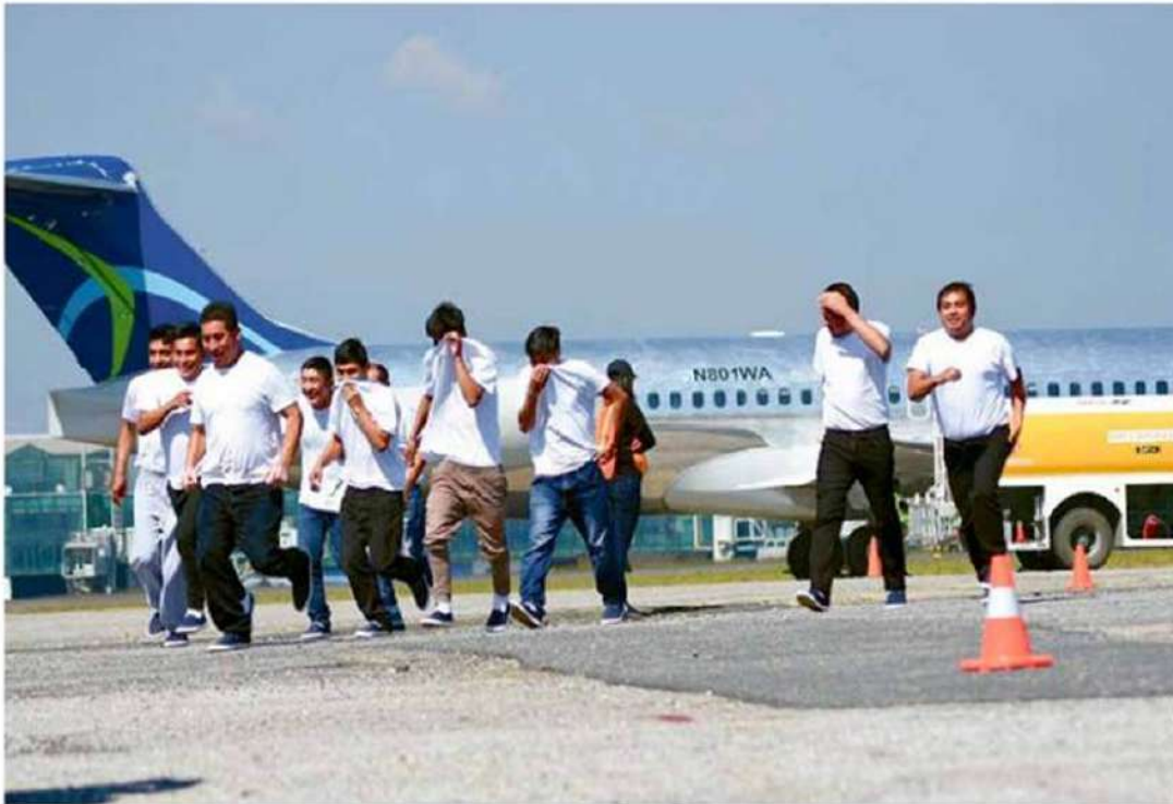
Hasta julio pasado, poco más de 26 mil personas retornaron al país en vuelos de deportados desde Estados Unidos, la mayoría de ellos hombres mayores de edad.